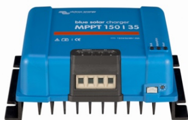
Zonne-laadcontroller MPPT 150/35