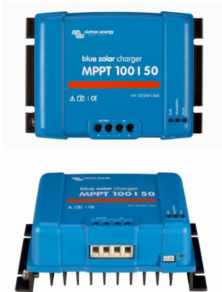
Solar Charge Controller MPPT 100/50